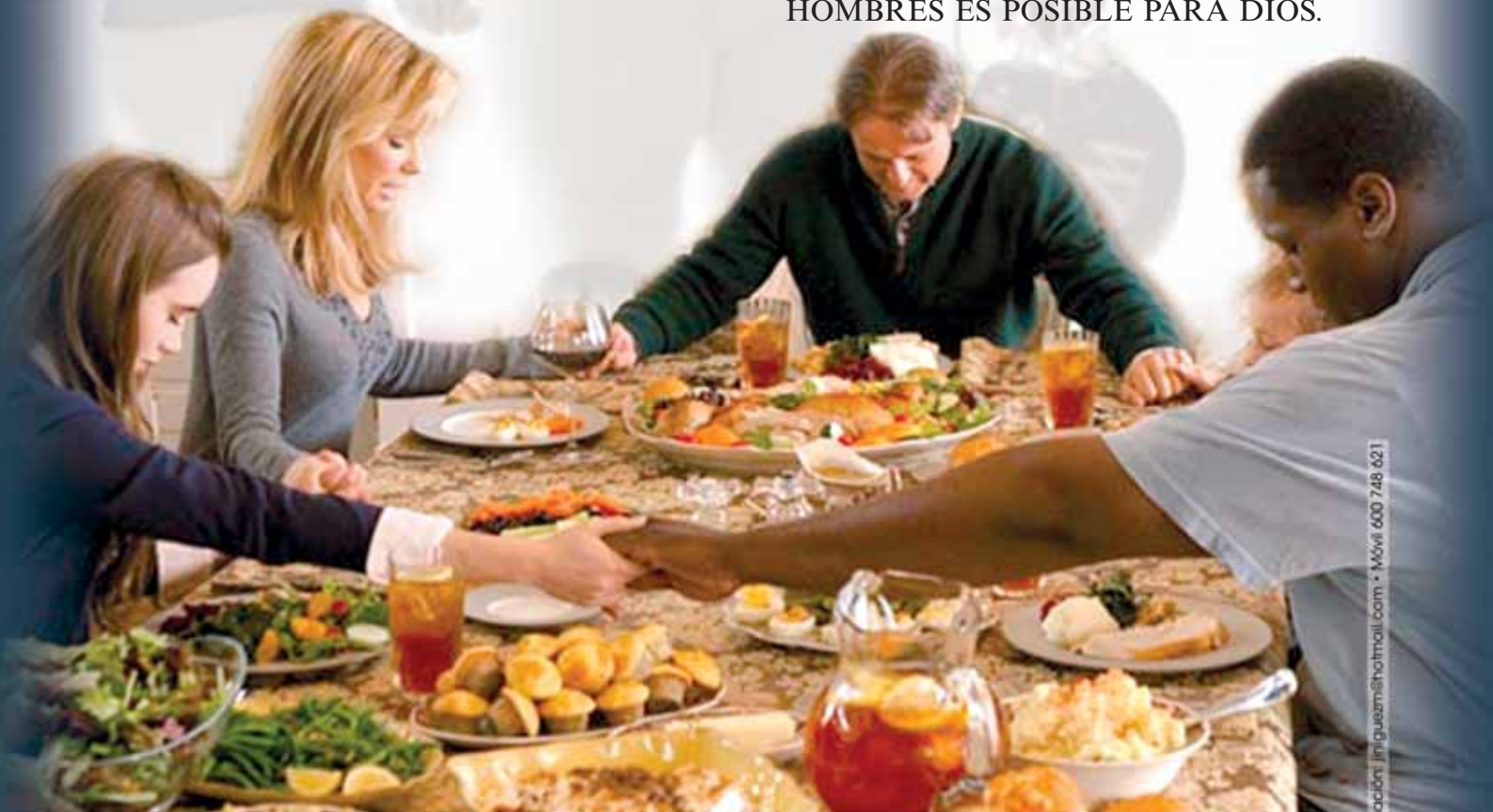
Guías elaboradas por Semana de Cine Espiritual.

LO QUE NO ES POSIBLE PARA LOS HOMBRES ES POSIBLE PARA DIOS.